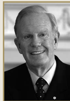
Ted Rogers, O.C., Photo utilisée avec sa permission.

La Chancellerie des distinctions honorifiques souhaite reconnaître la contribution de feu Ted Rogers, O.C., à la diffusion des investitures de l'Ordre du Canada dans toutes les régions du pays. Depuis son investiture en 1991, les récipiendaires reçoivent une copie vidéo de leur cérémonie.