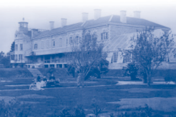
Lord Monck et sa famille dans les jardins ornementaux de Rideau Hall (1868)

Depuis la création du domaine, les jardins ornementaux ont toujours fait partie intégrante du paysage de Rideau Hall. À travers les ans, ils ont subi plusieurs transformations reflétant la tendance de l'époque. Sous le règne de Victoria (1837-1901), ces jardins ont arboré les formes les plus diverses allant de trèfles aux étoiles, en passant par les formes géométriques. Puis, à partir du XX e siècle, les lignes se sont adoucies pour offrir aujourd'hui une mosaïque de couleurs, de textures et de parfums.