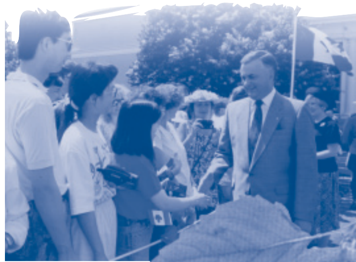
Des membres du public rencontrent le Gouverneur général Ramon J. Hnatysbyn lors d'une Fête champêtre à Rideau Hall (1993)

Encore aujourd'hui, les jardins ornementaux, composés de plantes vivaces, sont utilisés non seulement comme lieu de recueillement, mais également dans le cadre de réceptions officielles. De même, tous les ans, les Canadiens sont invités à rencontrer le gouverneur général lors de la fête champêtre tenue dans les jardins et sur le domaine de Rideau Hall.