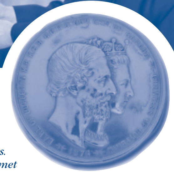
Médaille académique du Gouverneur général du Canada (avers) (Dufferin, 1876)

Depuis plus de 130 ans, les gouverneurs généraux du Canada ont pour tradition d'encourager l'excellence. Ils ont ainsi créé plus d'une soixantaine de prix et de trophées pour les arts, les sciences sociales, les lettres, les sciences humaines et les sports. Chaque année, le gouverneur général remet divers ordres, décorations et médailles aux personnes s'étant distinguées. Il s'agit d'une façon de leur rendre hommage et de les remercier, au nom de tous les Canadiens, pour leur contribution à la société. Parmi ces distinctions, l'Ordre du Canada représente la plus haute marque d'estime que le pays puisse accorder à ses citoyens en reconnaissance de réalisations, de mérite ou de services exceptionnels.