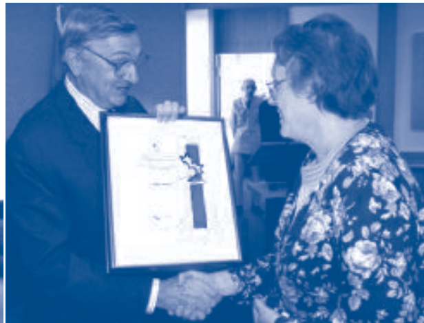
Le Gouverneur général Roméo LeBlanc remet le Prix du Gouverneur général pour l'entraide (1996)